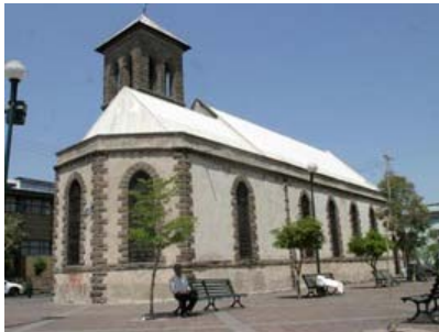
Iglesia Nacional Presbiteriana ubicada en Reforma y Alcalde. M. FREYRIA

◦ La Luz del Mundo tiene el templo más grande de Latinoamérica